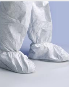
Blanco: TYV POSAS WH 00

Talla / Referencia para indicar en el pedido: 36 a 42 (C11647199) 42 a 46 (C11647207)