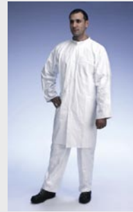
Blanco: TYV PL30S WH NP

Talla / Referencia para indicar en el pedido: S (C11309677) / M (C11309682) / L (C11309692) / XL (C11309701) / XXL (C11309712)