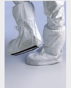
Blanco: TYV POBAS WH 00

Talla / Referencia para indicar en el pedido: Talla única (C11054659)