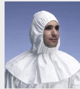
Blanco: TYV PH30S WH L0

Talla / Referencia para indicar en el pedido: Talla única (C11054670)