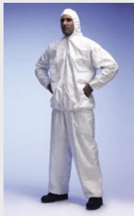
Blanco: TYV PP33S WH 00

Talla / Referencia para indicar en el pedido: S (C10954518) / M (C10954539) / L (C10954556) / XL (C10954566) / XXL (C10954586)