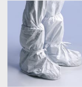
Blanco: TYV POBOS WH 00

Talla / Referencia para indicar en el pedido: Talla única (C11054644)