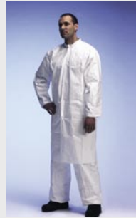
Blanco: TYV PL30S WH 00

Talla / Referencia para indicar en el pedido: M (C11054701) / L (C11054719) / XL (C11054721) / XXL (C11054737)