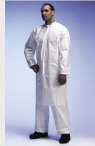
Blanco: TYV PL30S WH 09

Talla / Referencia para indicar en el pedido: S (C11309729) / M (C11309733) / L (C11309745) / XL (C11309759) / XXL (C11309760)