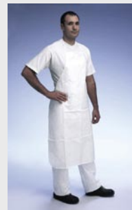
Blanco: TYV PA30S WH L0

Talla / Referencia para indicar en el pedido: Talla única (C11054695)