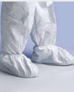
Blanco: TYV POSAS WH 00

Talla / Referencia para indicar en el pedido: 36 a 42 (C11647199) 42 a 46 (C11647207)