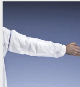
Blanco: TYV PS32S WH LA

Talla / Referencia para indicar en el pedido: Talla única (C11340778)