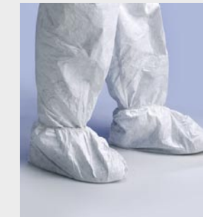
Blanco: TYV POSOS WH 00

Talla / Referencia para indicar en el pedido: Talla única (C11054667)